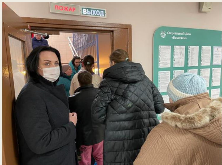
Эвакуация по лестничной клетке