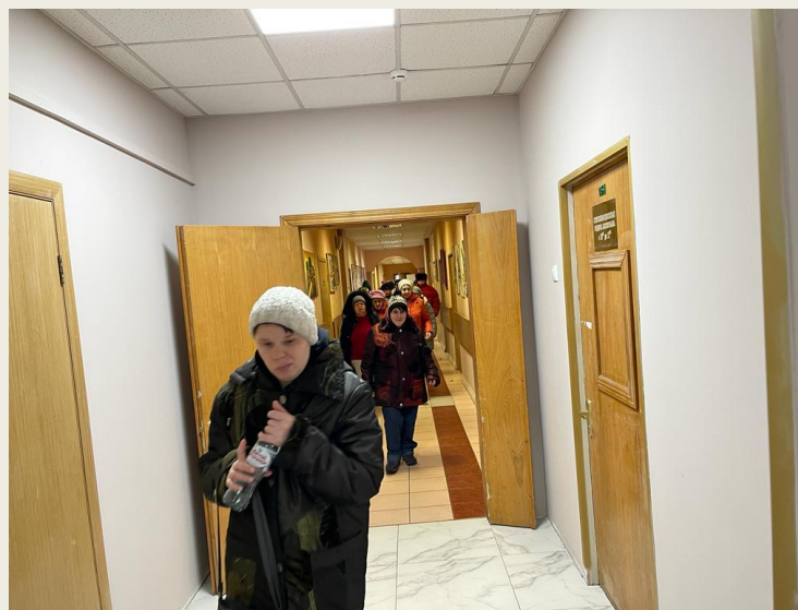
Проверка дежурным персоналом помещений после эвакуации