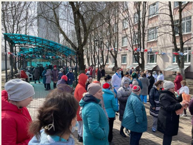
Сбор проживающих в безопасном месте