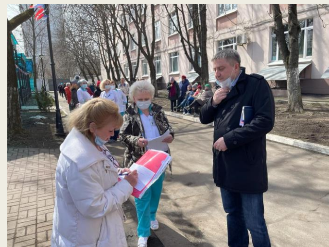
Доклад по итогам эвакуации