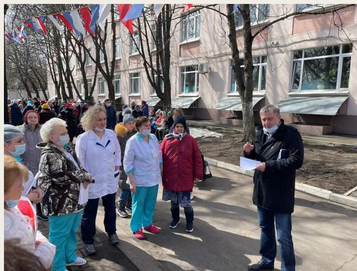
Подведение итогов эвакуации